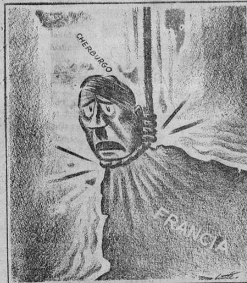
Little en el Nashville Tennessee.

Lava mucho mejor y rinde mucho más el Jabón YELOS cuya fama crece día a día, por su magnífica calidad y bajo precio.